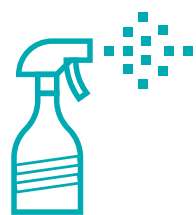
清掃・衛生の徹底